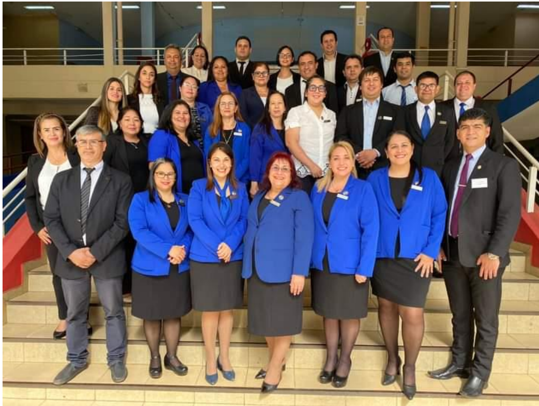
Evaluación externa de la Carrera de Enfermería Casa Central