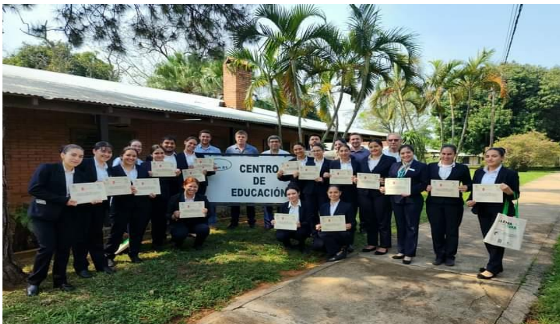
Capacitación de Estudiantes