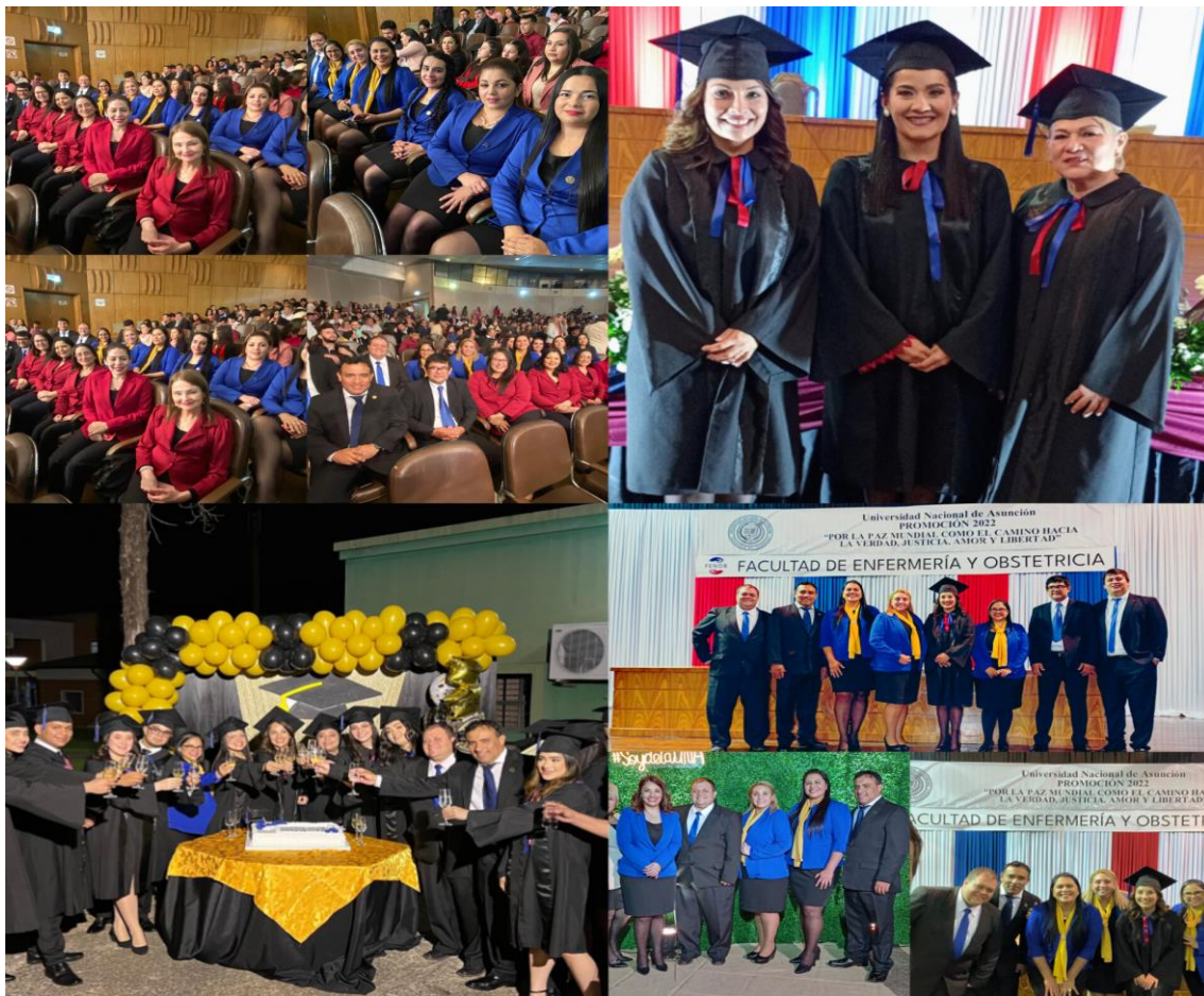
Acto de Graduación Promoción 2022 de la Carrera de Enfermería